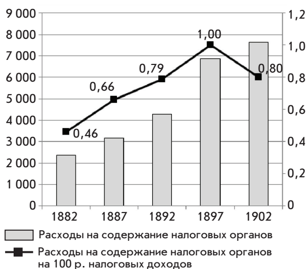
Рис. 2. Издержки налогового администрирования в России в конце XIX—начале XX вв. (составлено по: [3])

Самые ранние статистические данные, по которым можно провести корректную оценку ИНА в России, относятся к концу XIX—началу XX вв. Напомним, что в начале 80-х гг. XIX в. усложняющаяся налоговая система потребовала реформ в области контроля и создания соответствующих административных учреждений, а с 1885 г. в России началось становление специализированной податной службы. Этот период характеризуется относительно незначительной суммой бюджетных средств, расходуемых на содержание налоговых органов, однако за 20 лет эти расходы выросли почти в четыре раза в абсолютном выражении и в два раза по сравнению с ростом налоговых доходов (рис. 2).